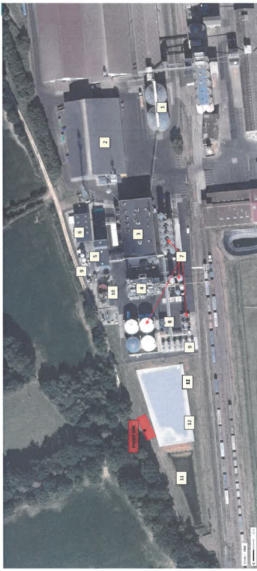
ANNEXE 3 : plan de situation « activité industrielle »

à l'arrêté N°2023 DCPAT/BE -036 en date du 13 février 2023 fixant des prescriptions complémentaires à la société Centre Céréales, pour son établissement de Chalandray